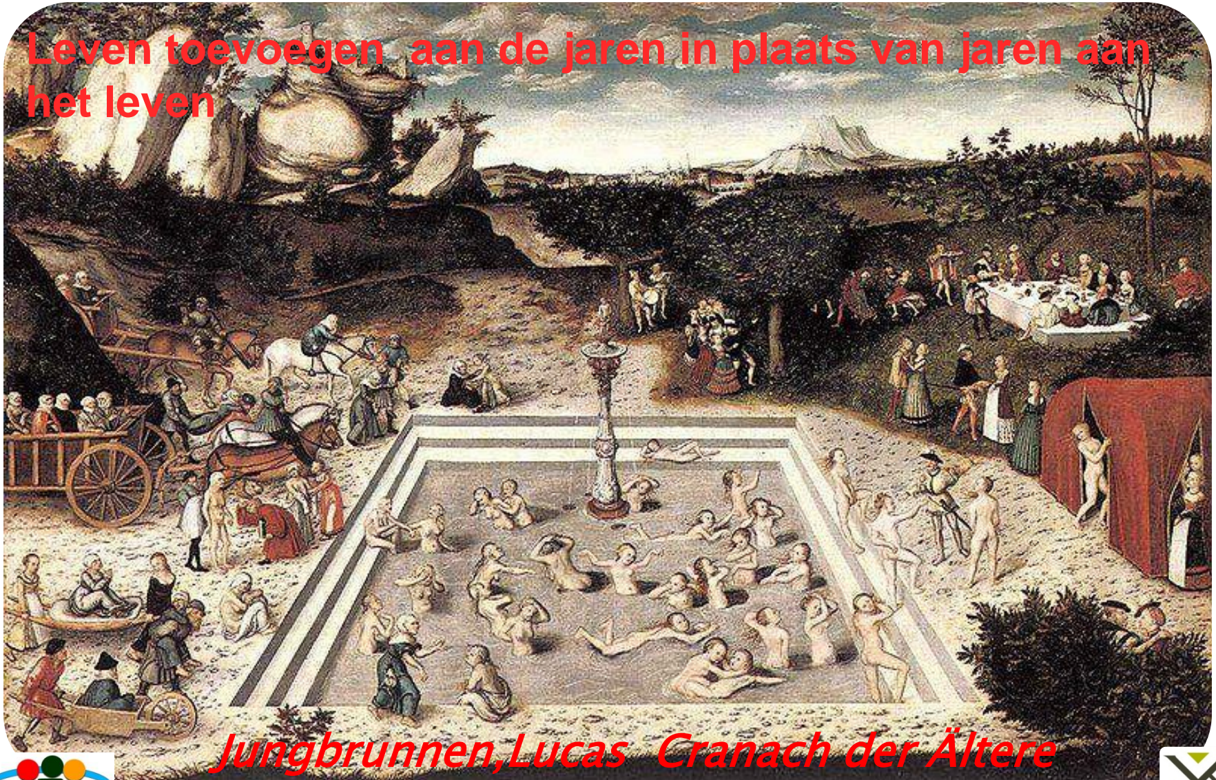
Jungbrunnen, Lucas Cranach der Ältere

Leven toevoegen aan de jaren in plaats van jaren aan het leven